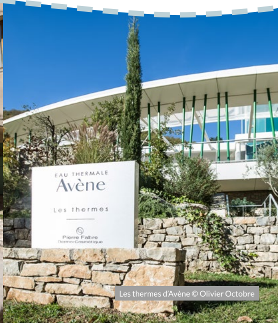
Les thermes d'Avène

Le village d'Avène, né bien avant le XII e siècle, est blotti dans la vallée de l'Orb, au cœur du Parc Naturel régional du Haut Languedoc. Sa situation géographique exceptionnelle, la beauté du paysage, la richesse de la végétation et de sa géologie en font un endroit rare.