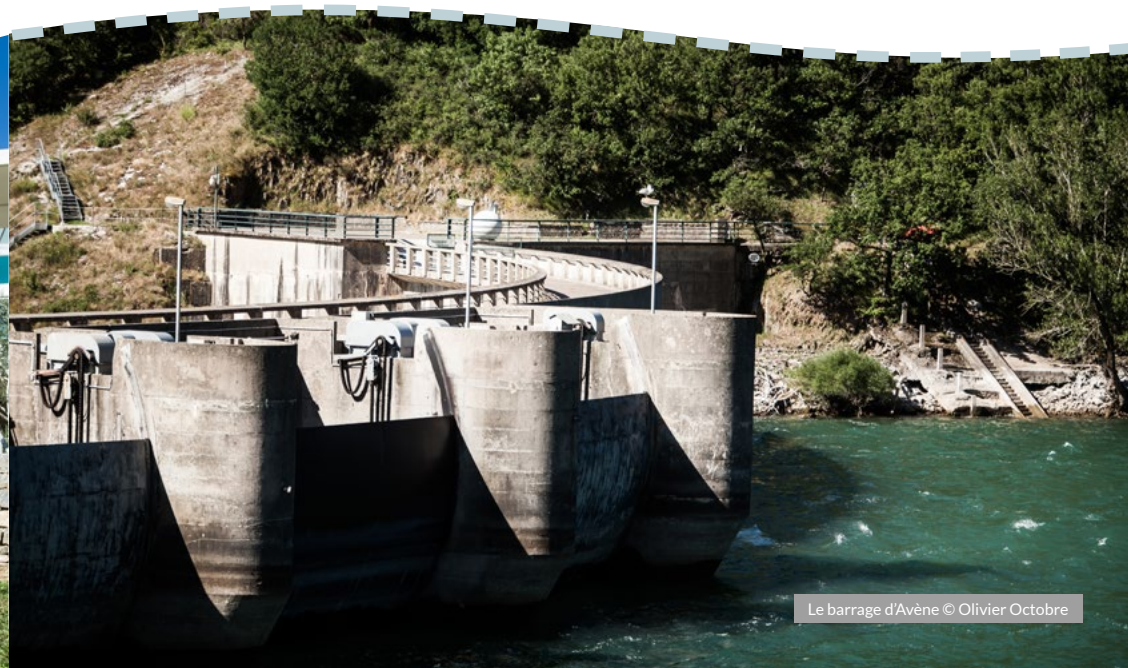
Le barrage d'Avène

Créé en 1962, entre Ceilhes-et-Rocozels au nord et Avène au sud, il est long de 6 kilomètres pour une surface de 190 hectares.