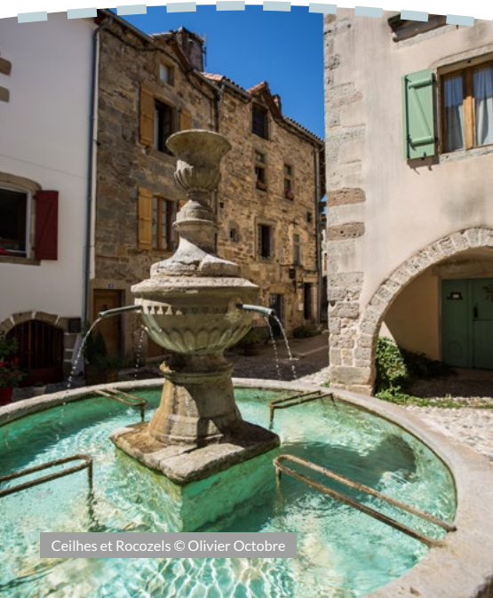
Ceilhes et Rocozels

Enfin le plan d'eau du Bouloc. Il permet la pratique d'activités nautiques. Son eau de qualité est réputée pour la pêche à la carpe.